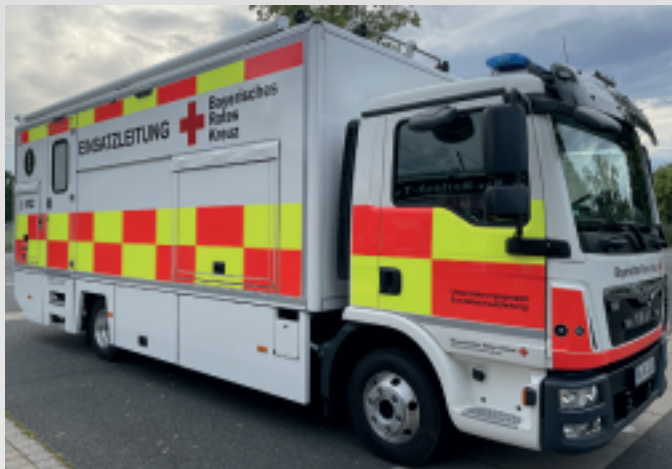
Neuer Einsatzleitwagen Moderne Technik und Ergonomie

Patienten und zu Betreuende werden dort registriert. Außerdem erfolgt die Dokumentation des gesamten Einsatzgeschehens vom ELW aus. Dafür sind verschiedene technische Geräte wie etwa Mobilfunk, Internet, Digitalfunk und Fax erforderlich. Der ELW bringt diese komplette Kommunikationsinfrastruktur an die Einsatzstelle.